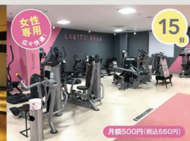
レディースエリア