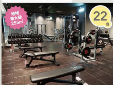
フリーウエイトエリア