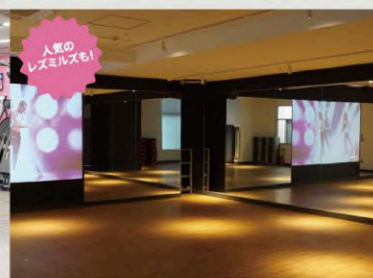
ヴァーチャルスタジオ